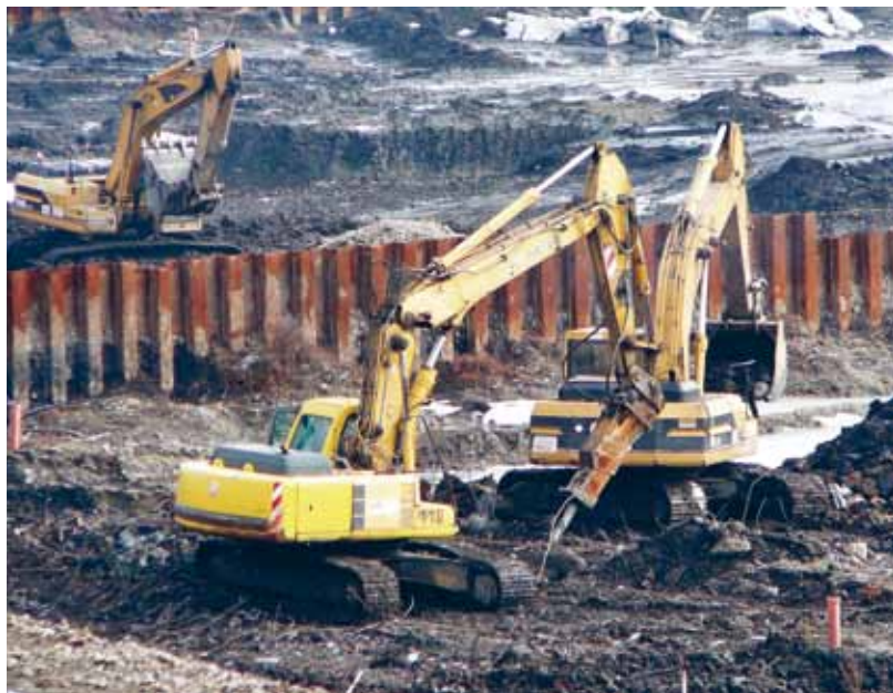
Koncem února začali stavbaři odčerpávat vodu z vyhloubených základů budoucího obchodního centra, začaly i další stavební práce.