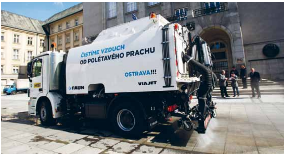
Město před rokem za 6,5 milionu korun zakoupilo speciální čistící vůz, který pomocí vysokotlakého vodního zařízení nasává i nebezpečný polévatý prach.